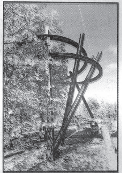
Under uppförande: stålskulptur av Serge Spitzer.

Dock, frågar en tidig kvinnlig besökare, vart har alla kvinnor tagit vägen?