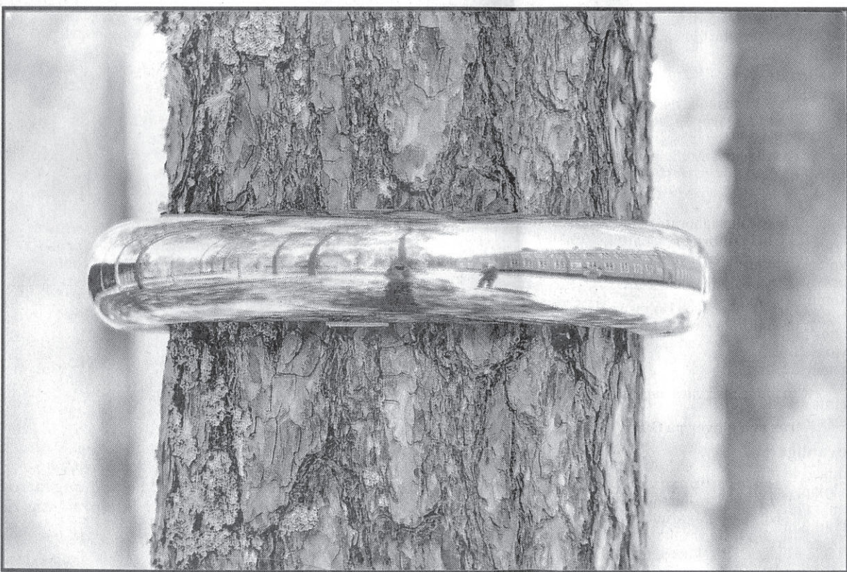
Alliansring av Anna Renström.